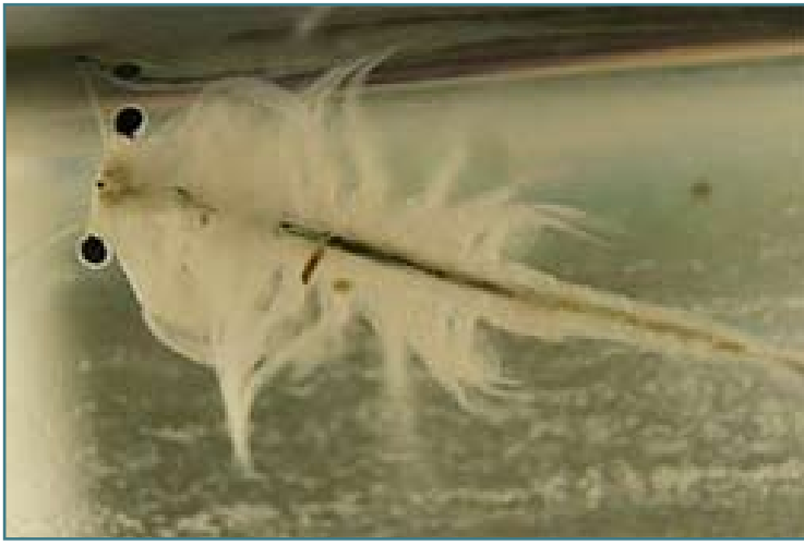
Schwimmender Artemia Salina

3. Bearbeitung mit Süßwasser und Salz. Getrocknete Artemiacysten werden in Süßwasser bei einer Temperatur von 25–30 °C über einen Zeitraum von zwei Stunden eingeweicht. Danach werden sie abgesiebt und 24 Stunden in gesättigter Salzlösung gehalten. Dieser Prozess wird drei Mal wiederholt, bevor man dann schließlich die Artemiacysten in den Brutautomaten gibt.