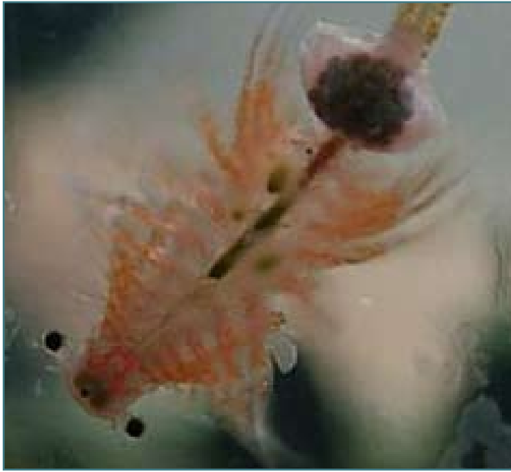
Artemia Weibchen mit Eiersack

1979 wurden in den USA Bohrungsarbeiten im Gebiet des Großen Salzsees im Norden Utahs durchgeführt. Zwischen zwei Salzsichten einer Bodenprobe stieß man auf Artemiacysten, deren Radiokohlenstoffalter auf 10.000 Jahre bestimmt wurde. Nach der Inkubation sind Nauplien geschlüpft.