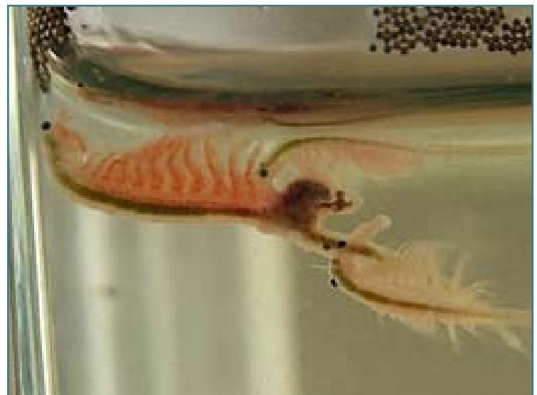
Artemia Weibchen und Männchen

Artemien sind Rückenschwimmer. Sie schwimmen mit der Körperunterseite nach oben, zum Licht gerichtet und filtern die Nahrung mit Hilfe ihrer behaarten Beine aus dem Wasser. Hierbei haben sie keine Möglichkeit, Nahrung von anderen im Wasser schwimmenden Teilchen zu unterscheiden; so gelangen z.B. Sandkörner und alimentäre Teilchen gemeinsam in die Mundöffnung. Feste Teilchen, die